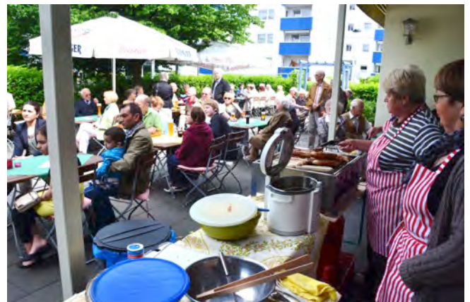
Platz da, die Wurst kommt: Die Cafeteria-Damen bruzzeln Köstliches