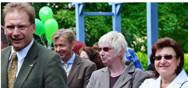
Sehen wir doch gerne: lachende Gesichter