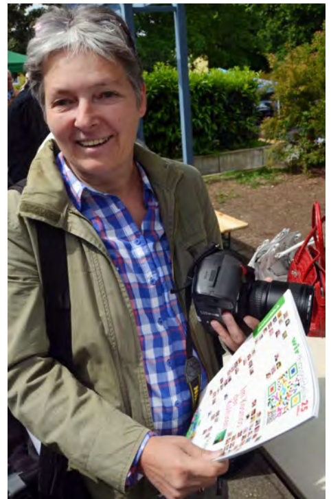
Voll informiert: Fotografin Christa Kastner