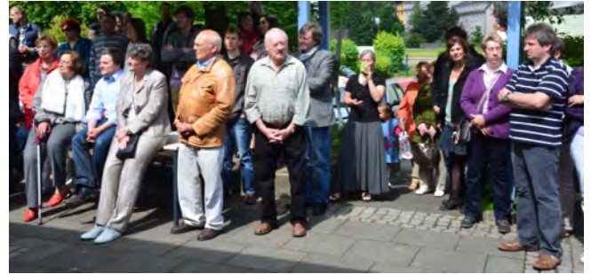
Hören geduldig zu: Vereinsmitglieder, Gäste, Freunde, Besucher, Hasseldellianer

Das diesjährige, traditionelle Sommerfest am 2. Juni 2012 war zugleich eine offene Jubiläumsveranstaltung , bei der sozusagen „das ganze Dorf auf den Beinen war“.