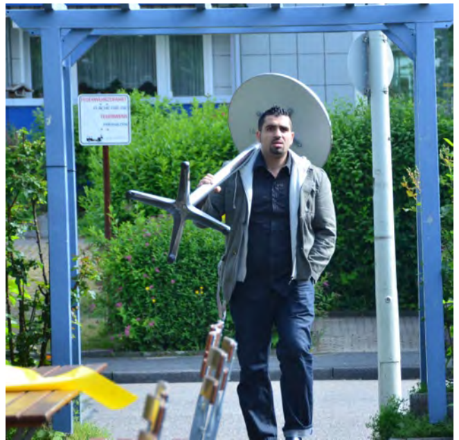
Die Party kann beginnen: jeder bringt einen Tisch mit