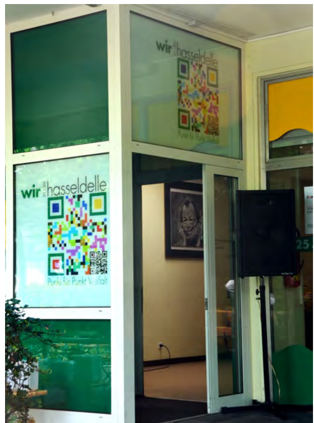
Immer eine offene Tür: Bürgerzentrum Hasseldelle

Sinnig: Bigband der Jugendmusikschule Solingen bestätigt, jeder könne es einmal versuchen .... :-)