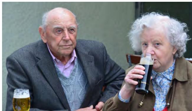
Na dann: Prost !