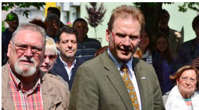
Strahlende Gesichter – doch hoffentlich nicht verblendet ... ??? :- ) – Nein: nur fröhlich-verkniffen im Sonnenschein