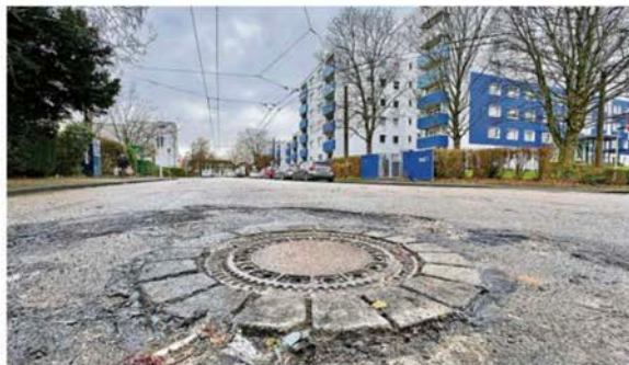
In der Hasseldelle hatte es in der Silvesternacht Krawalle gegeben. Brennende Straßenbarrikaden zerstörten den Asphalt, Feuerwehrleute wurden mit Raketen beschossen.

ge, mit solchen Verträgen und schlechterer Bezahlung sind die jungen Menschen oft nur schwer zu halten.